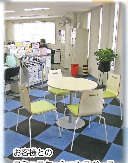
お客様との コミュニケーションスペース