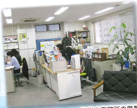
社労士事務所の風景